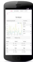
Analyse – etwa per Smartphone