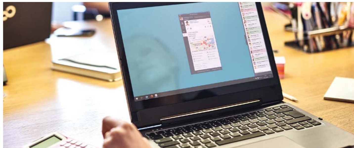
Im Dashboard werden zentrale Informationen aus ERP, CRM und Co direkt bei Anrufeingang angezeigt.