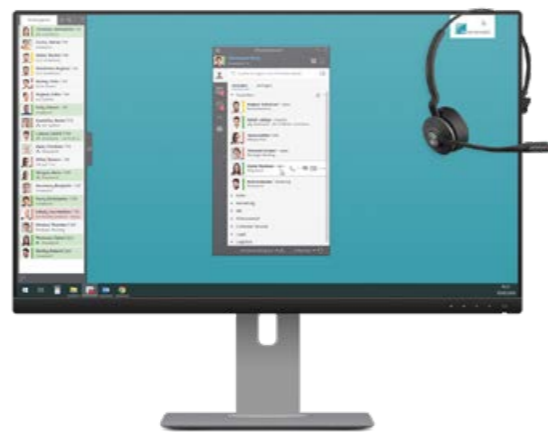
Der Client ist Ihre Kommunikationszentrale: Sehen Sie, wer erreichbar ist, und starten Sie Anruf, Chat oder Konferenz im Handumdrehen.

Mit dem leistungsstarken Faxmodul lassen sich Faxe aus jeder Windows-Anwendung versenden und in Outlook oder im XPhone Connect Client ablegen. Der Fax-Editor ermöglicht Serienfaxe, personalisierte Faxe und den zeitversetzten Versand. Natürlich erreichen eingehende Faxe Sie direkt am Arbeitsplatz – ohne lästige Lauferei zum Faxgerät.