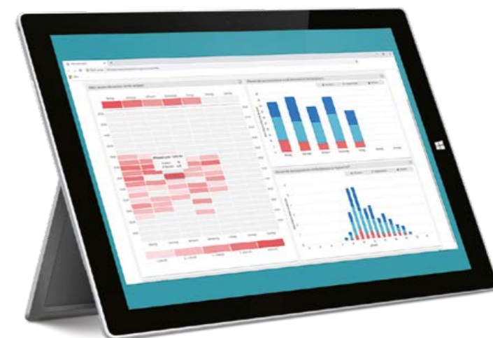
Mehr Übersicht für bessere Entscheidungen mit XPhone Connect TeamDesk & Analytics.

Nutzen Sie das volle Potenzial Ihrer Daten! Ob Kundennummer oder Bestellhistorie: Mit dem Dashboard werden zentrale Informationen zum Kontakt direkt bei Anrufeingang angezeigt. Gleichzeitig können Sie direkt aus dem Client Aktionen in Ihren Geschäftsanwendungen starten (z. B. „Verkaufschance anlegen“, „Neuer Termin“ etc.).